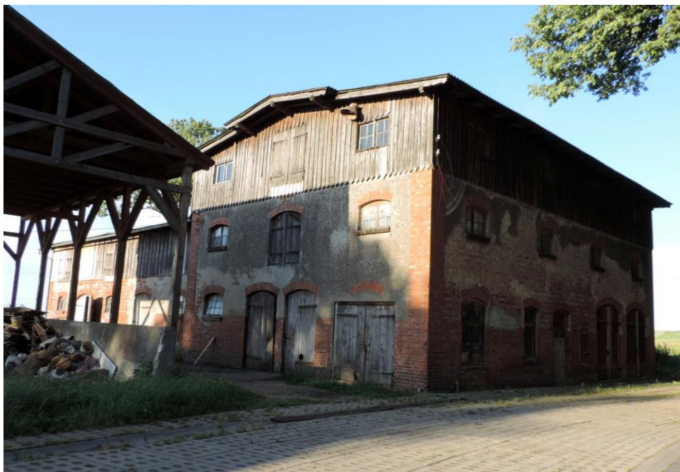
Widok budynku od południowego-zachodu

8. Fotografia z opisem wskazującym orientację albo mapa z zaznaczonym stanowiskiem archeologicznym