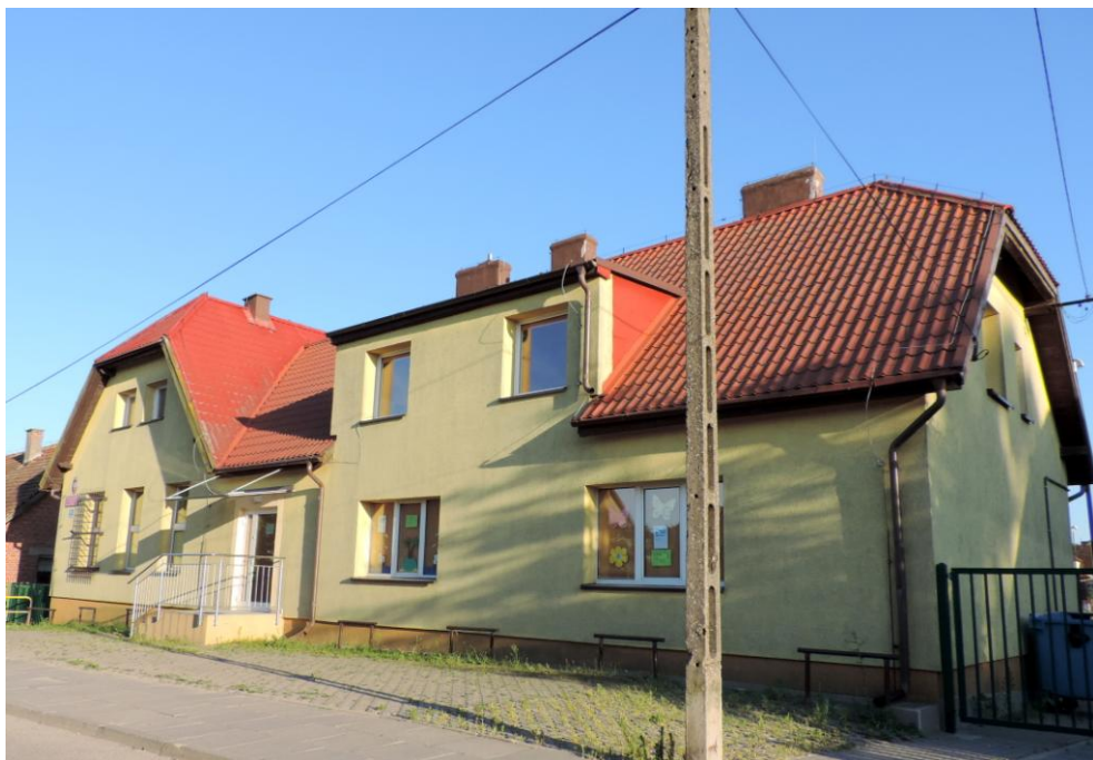
Widok budynku od północno-zachodu

8. Fotografia z opisem wskazującym orientację albo mapa z zaznaczonym stanowiskiem archeologicznym