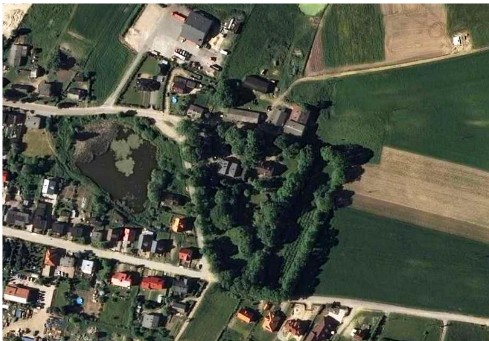
Widok z lotu ptaka

8. Fotografia z opisem wskazującym orientację albo mapa z zaznaczonym stanowiskiem archeologicznym