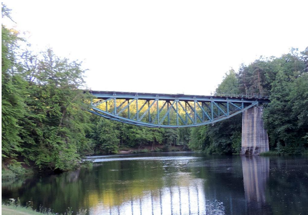
Widok od północnego-zachodu

8. Fotografia z opisem wskazującym orientację albo mapa z zaznaczonym stanowiskiem archeologicznym