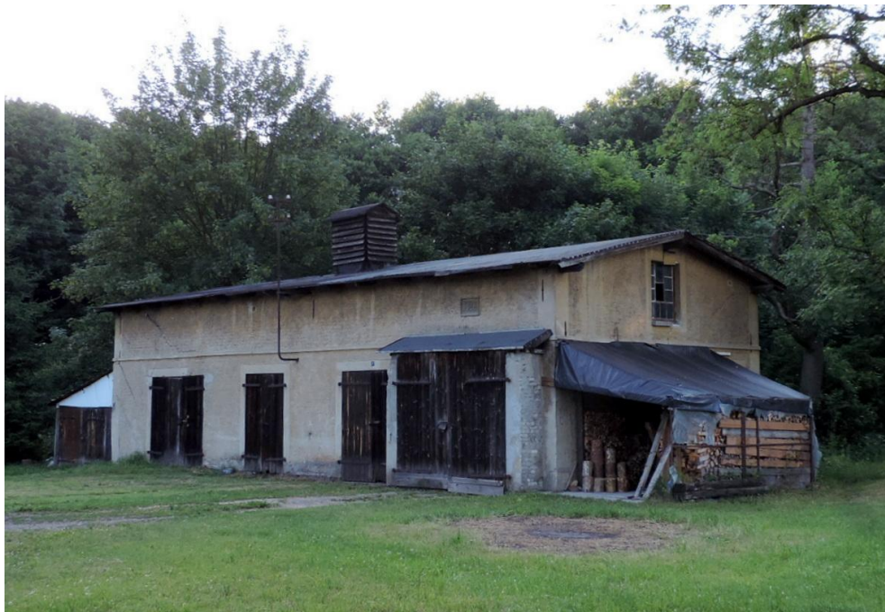
Widok budynku od południowo-wschodu

8. Fotografia z opisem wskazującym orientację albo mapa z zaznaczonym stanowiskiem archeologicznym