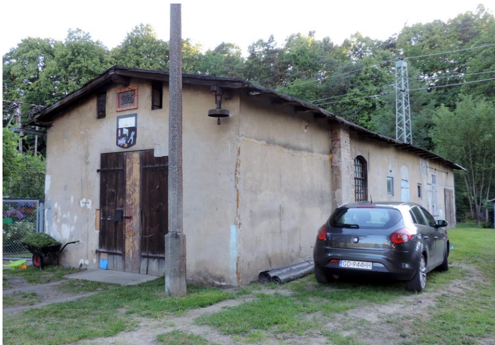
Widok budynku od północnego-wschodu

8. Fotografia z opisem wskazującym orientację albo mapa z zaznaczonym stanowiskiem archeologicznym