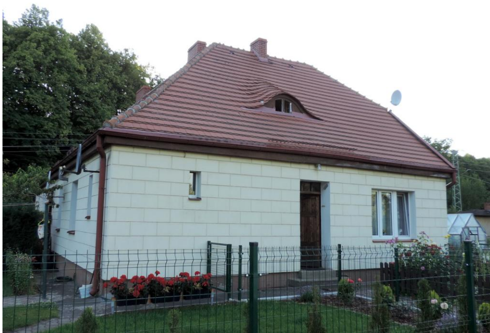
Widok budynku od wschodu

8. Fotografia z opisem wskazującym orientację albo mapa z zaznaczonym stanowiskiem archeologicznym