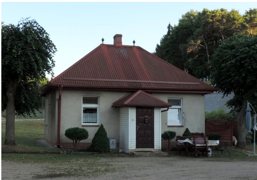
Widok budynku od północnego-wschodu

8. Fotografia z opisem wskazującym orientację albo mapa z zaznaczonym stanowiskiem archeologicznym