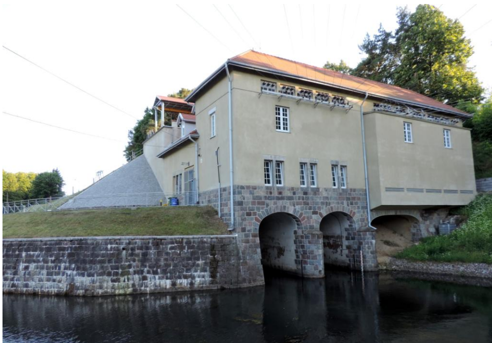
Widok budynku od północnego-wschodu

8. Fotografia z opisem wskazującym orientację albo mapa z zaznaczonym stanowiskiem archeologicznym