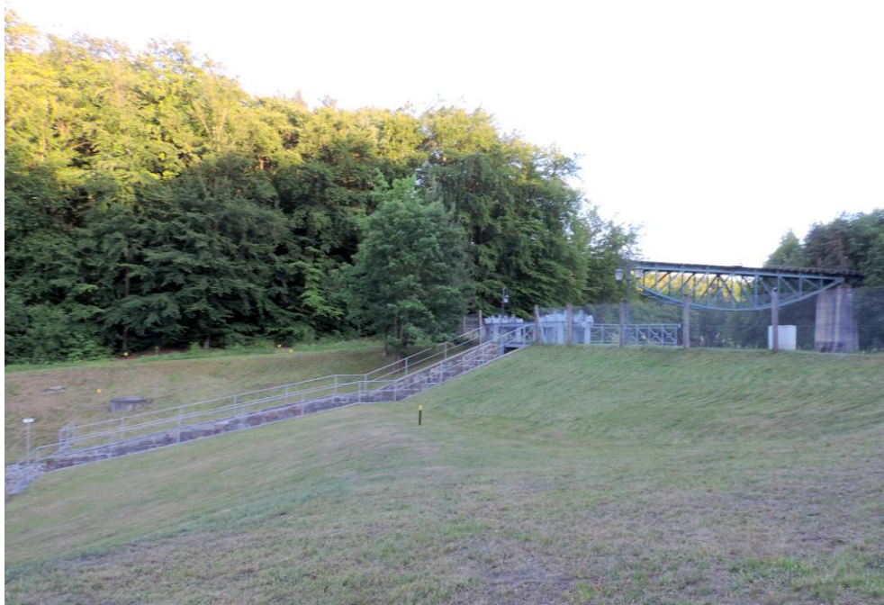
Widok od północnego-zachodu

8. Fotografia z opisem wskazującym orientację albo mapa z zaznaczonym stanowiskiem archeologicznym