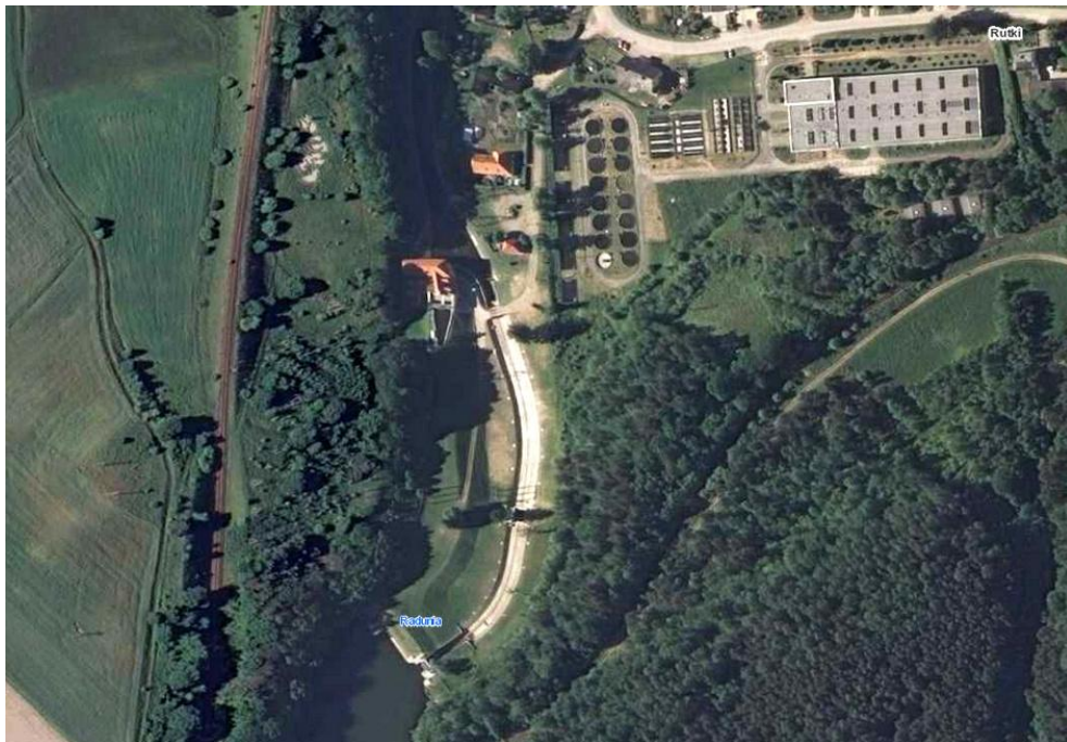
Widok z lotu ptaka

8. Fotografia z opisem wskazującym orientację albo mapa z zaznaczonym stanowiskiem archeologicznym