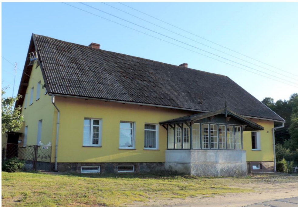
Widok budynku od północnego-wschodu

8. Fotografia z opisem wskazującym orientację albo mapa z zaznaczonym stanowiskiem archeologicznym