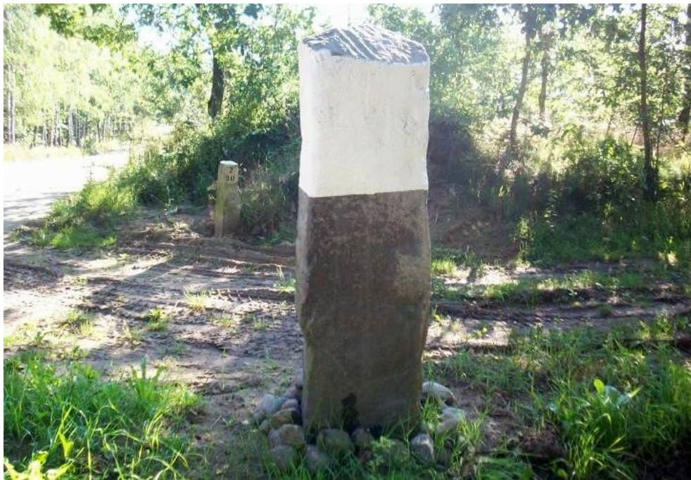
Widok od północnego-wschodu

8. Fotografia z opisem wskazującym orientację albo mapa z zaznaczonym stanowiskiem archeologicznym