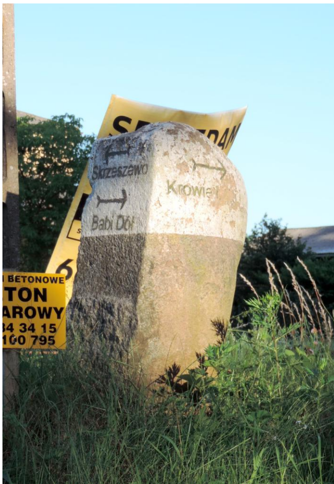
Widok od północnego-zachodu

8. Fotografia z opisem wskazującym orientację albo mapa z zaznaczonym stanowiskiem archeologicznym