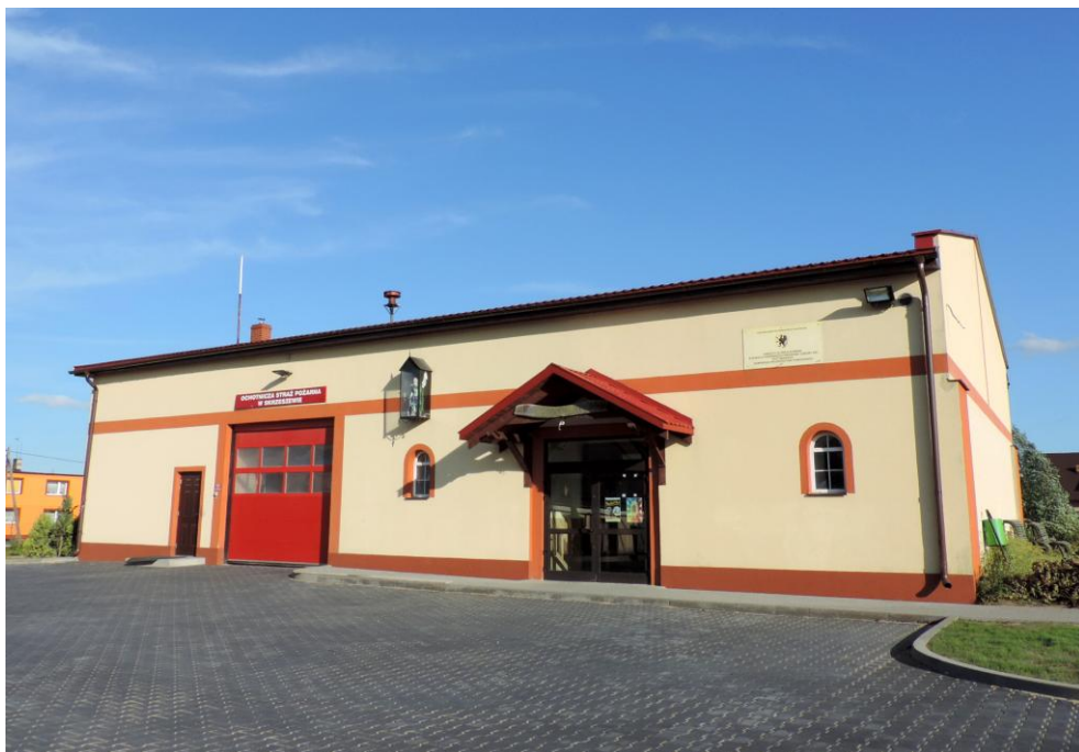
Widok budynku od północy

8. Fotografia z opisem wskazującym orientację albo mapa z zaznaczonym stanowiskiem archeologicznym