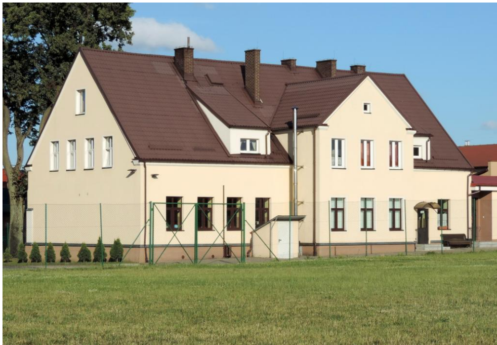
Widok budynku od północnego-zachodu

8. Fotografia z opisem wskazującym orientację albo mapa z zaznaczonym stanowiskiem archeologicznym