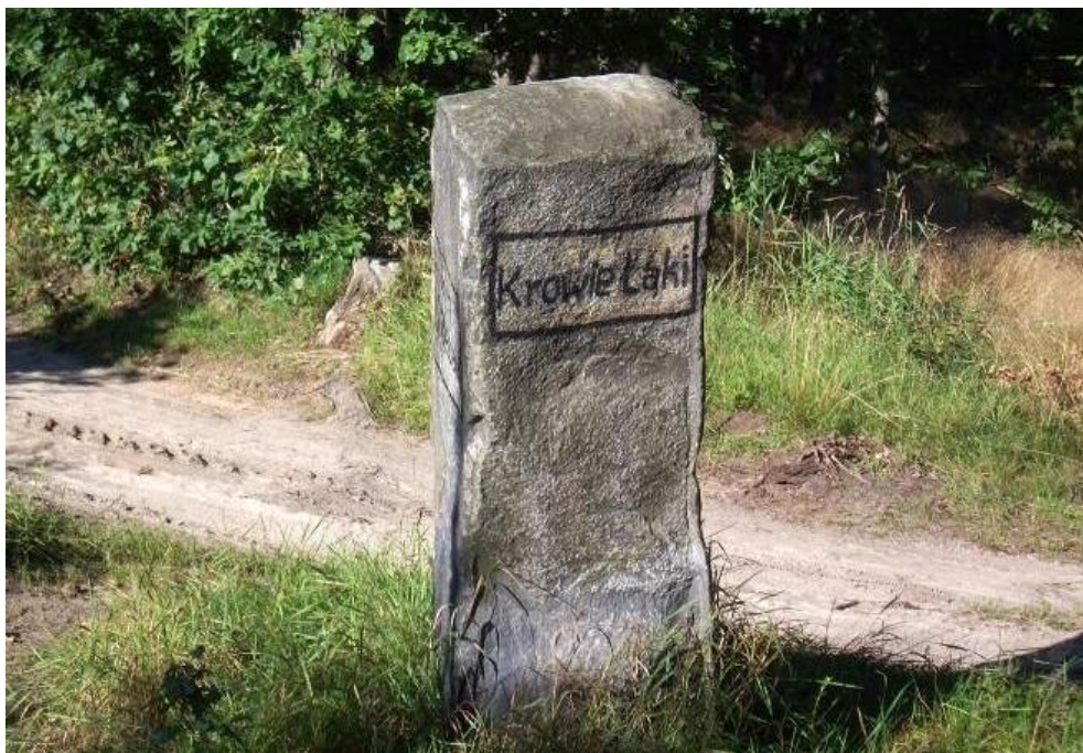
Widok od północnego-wschodu

8. Fotografia z opisem wskazującym orientację albo mapa z zaznaczonym stanowiskiem archeologicznym