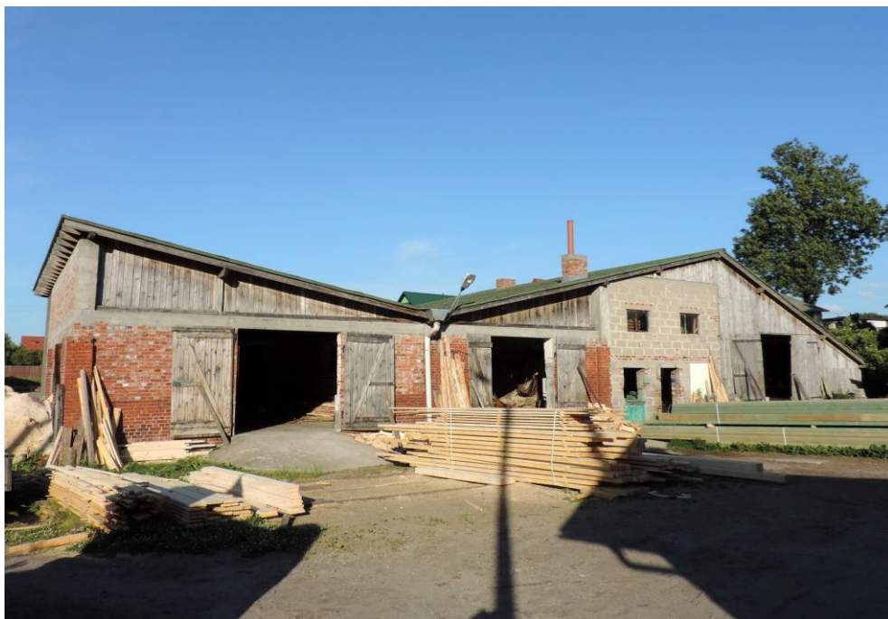
Widok budynku od zachodu

8. Fotografia z opisem wskazującym orientację albo mapa z zaznaczonym stanowiskiem archeologicznym