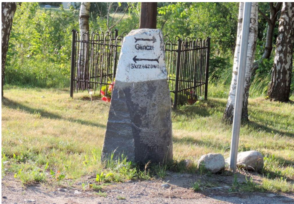
Widok od południowego-wschodu

8. Fotografia z opisem wskazującym orientację albo mapa z zaznaczonym stanowiskiem archeologicznym