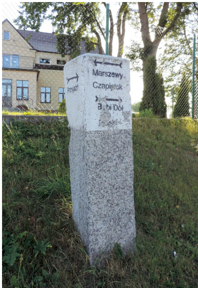
Widok od południowego-wschodu

8. Fotografia z opisem wskazującym orientację albo mapa z zaznaczonym stanowiskiem archeologicznym