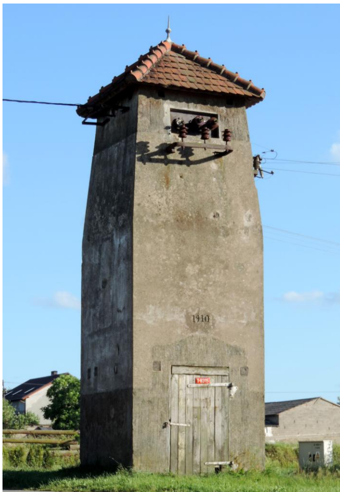
Widok od północnego-wschodu

8. Fotografia z opisem wskazującym orientację albo mapa z zaznaczonym stanowiskiem archeologicznym