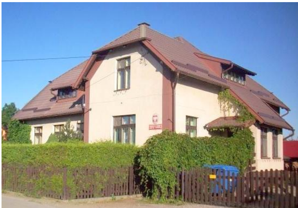
Widok budynku od południowo-wschodu

8. Fotografia z opisem wskazującym orientację albo mapa z zaznaczonym stanowiskiem archeologicznym