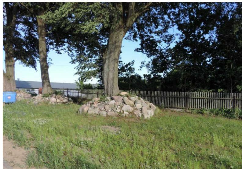
Widok od północnego-zachodu