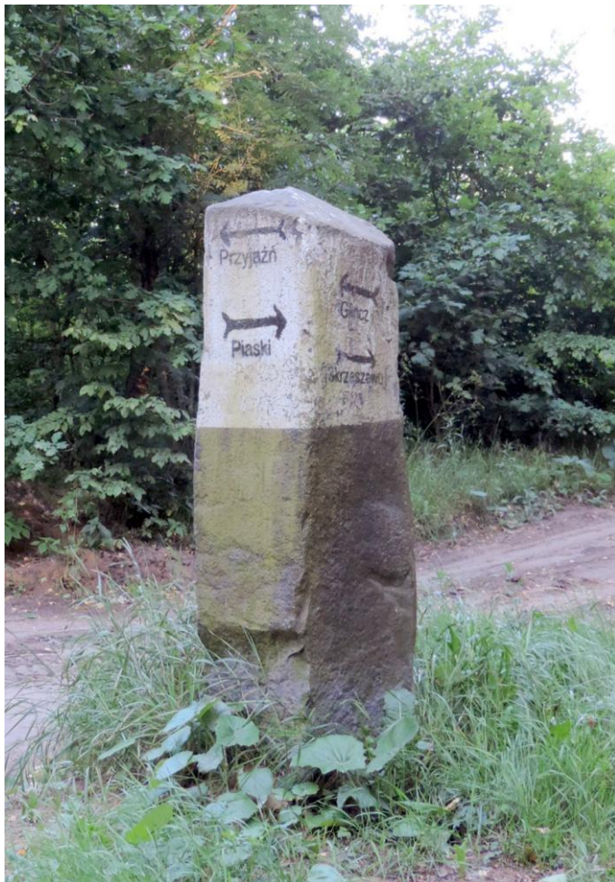
Widok od południowego-zachodu

8. Fotografia z opisem wskazującym orientację albo mapa z zaznaczonym stanowiskiem archeologicznym