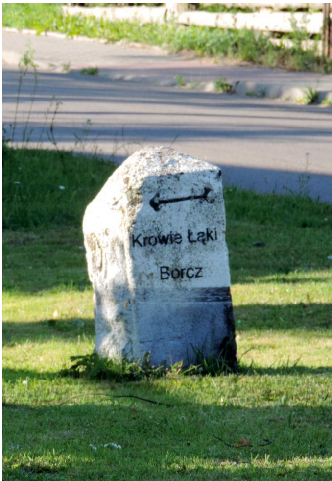
Widok od południowego-zachodu

8. Fotografia z opisem wskazującym orientację albo mapa z zaznaczonym stanowiskiem archeologicznym