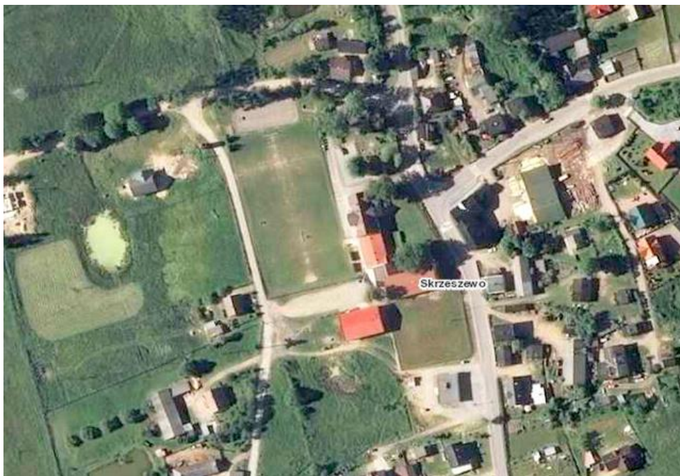
Widok z lotu ptaka

8. Fotografia z opisem wskazującym orientację albo mapa z zaznaczonym stanowiskiem archeologicznym