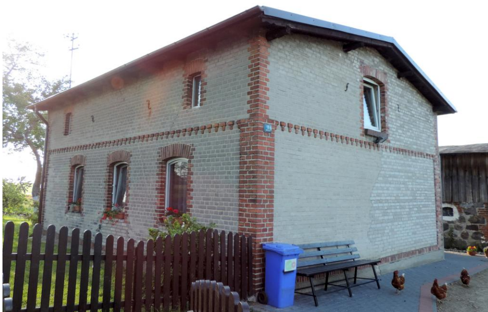
Widok budynku od południowo-wschodu

8. Fotografia z opisem wskazującym orientację albo mapa z zaznaczonym stanowiskiem archeologicznym