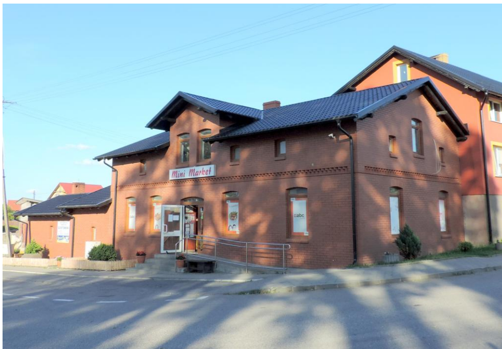
Widok budynku od północnego-zachodu

8. Fotografia z opisem wskazującym orientację albo mapa z zaznaczonym stanowiskiem archeologicznym