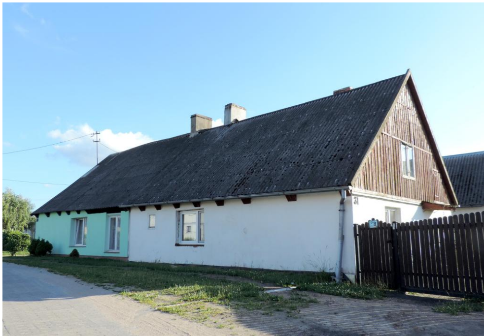
Widok budynku od północno-wschodu

8. Fotografia z opisem wskazującym orientację albo mapa z zaznaczonym stanowiskiem archeologicznym