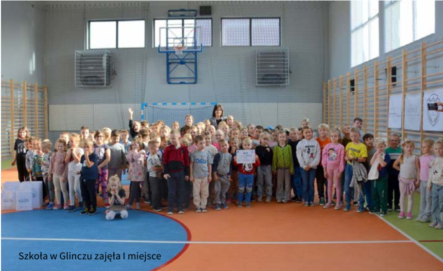
Szkoła w Glinczu zajęła I miejsce

Zdrowa rywalizacja, dziesiątki tysięcy przejazdów do szkół, promocja aktywnego trybu życia wśród dzieci – tak w skrócie możemy podsumować akcję „Wrzesień z rowerem w Gminie Żukowo”.