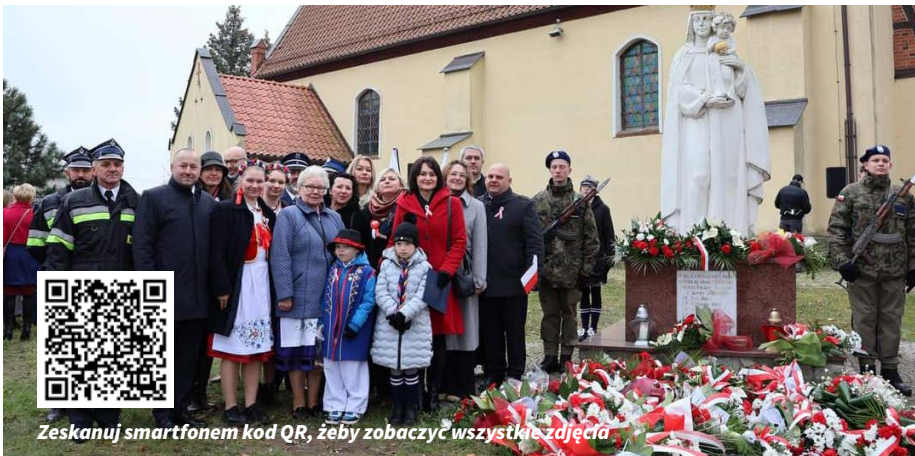
Zeskanuj smartfonem kod QR, żeby zobaczyć wszystkie zdjęcia