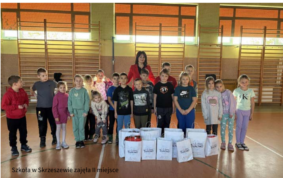
Szkoła w Skrzeszewie zajęła II miejsce