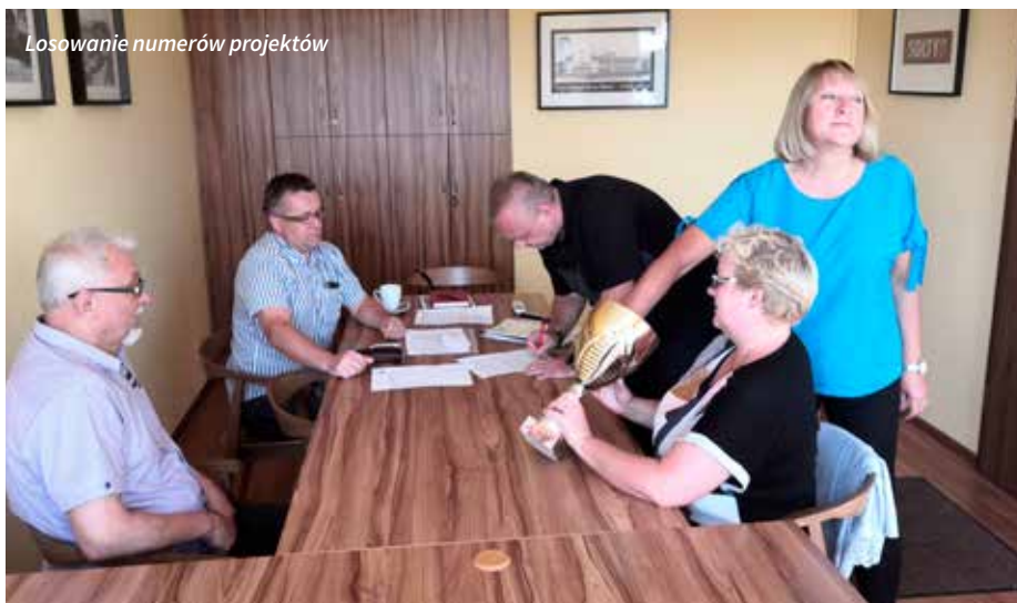
Losowanie numerów projektów

Za nami pierwsze etapy Budżetu Obywatelskiego. Urząd Gminy zweryfikował projekty pod kątem formalnym, a Zespół Konsultacyjny ocenił celowość i gospodarność projektów.