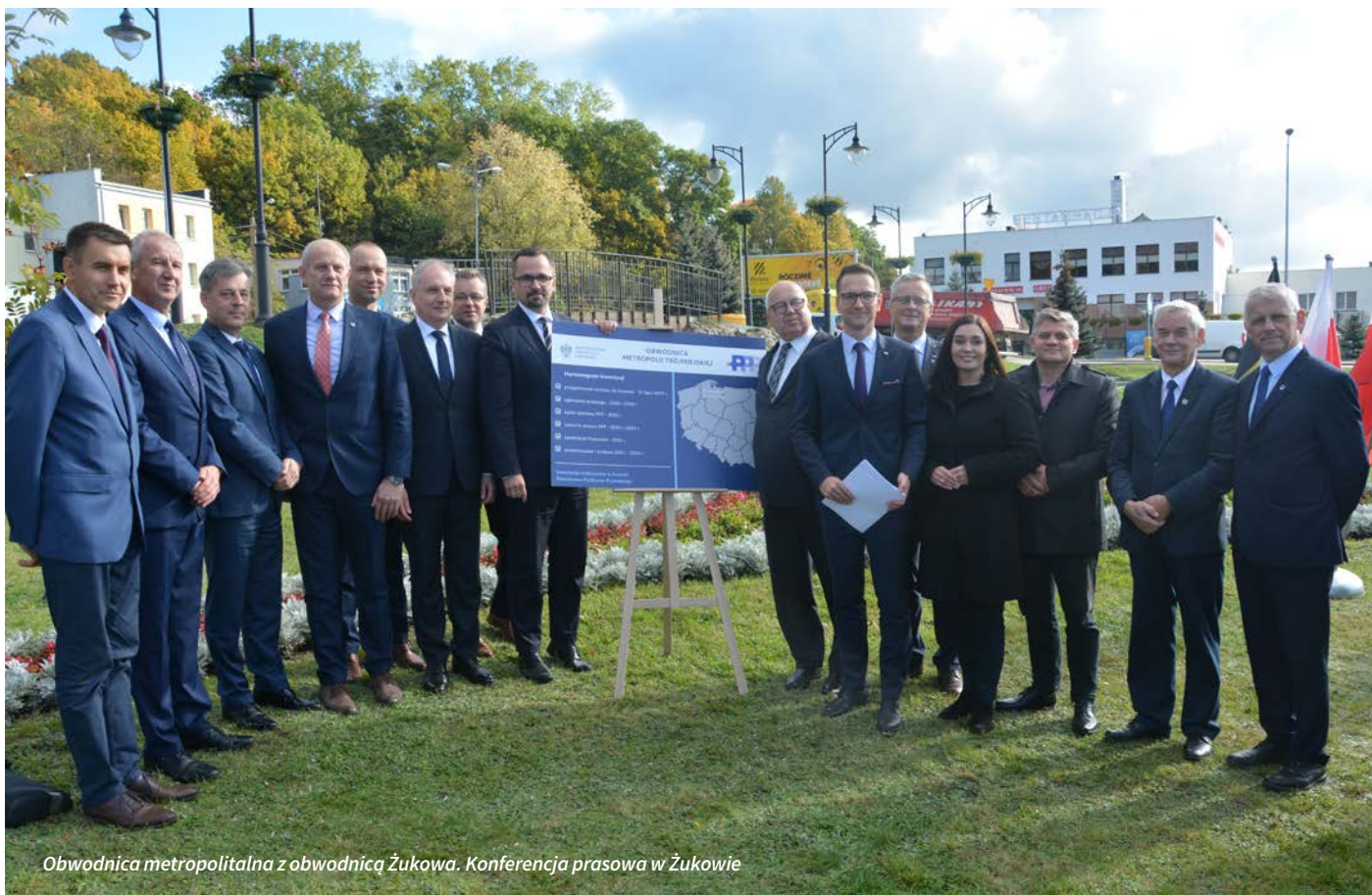
Obwodnica metropolitalna z obwodnicą Żukowa. Konferencja prasowa w Żukowie

M – Muza nad Jeziorkiem. Rockowe granie na scenie, eksplozje kolorów, zabawy dla dzieci, strefa relaksu i wiele innych atrakcji. Kolejna edycja Muzy nad Jeziorkiem zgromadziła tłumy miłośników dobrej zabawy.