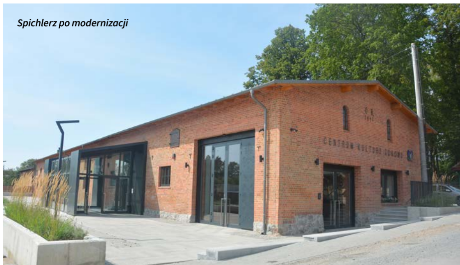
Spichlerz po modernizacji

U – Ulice Lisia i Dobrzewińska w Chwaszczyźnie oraz Jabłoniowa w Żukowie oficjalnie otwarte w 2019r. Zmodernizowane drogi sfinansowano przy wsparciu przedsiębiorców oraz Wojewody Pomorskiego (dwie pierwsze).