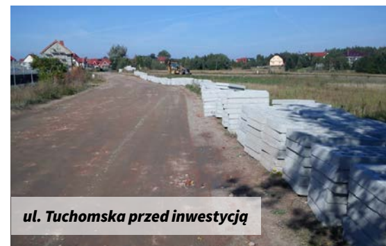
ul. Tuchomska przed inwestycją