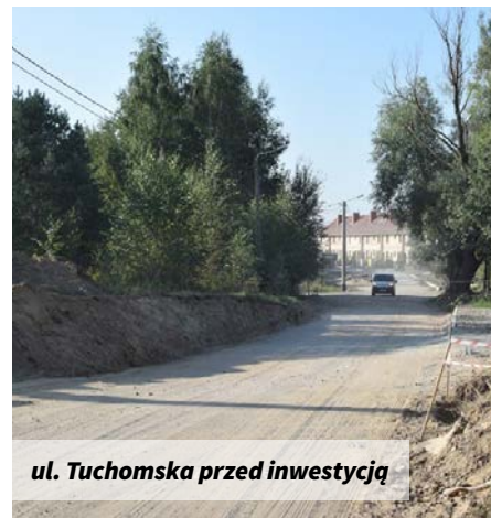
ul. Tuchomska przed inwestycją

Z kolei we współpracy z Powiatem Kartuskim realizowany jest chodnik Przyjaźń – Łąpino, na ten cel Gmina Żukowo przekazuje 250 tys. zł. W ramach poprawy bezpieczeństwa kolejne 50 tys. zł trafiły do Powiatu Kartuskiego na opracowanie dokumentacji projektowej rozbiórki i budowy nowego wiaduktu w Niestępowie. W planach realizacji z Powiatem są również chodniki na odcinkach: Niestępowo-Sulmin oraz kontynuacja chodnika Babi Dół – Skrzyszewo.