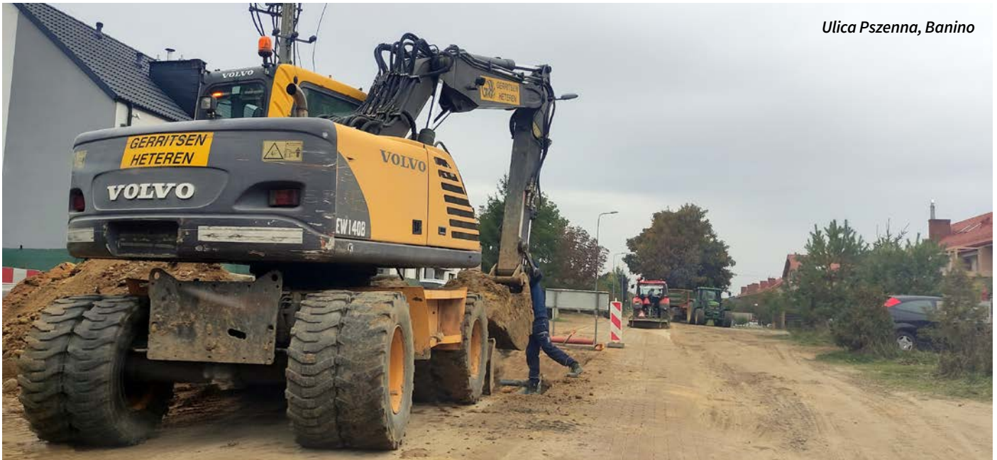
Ulica Pszenna, Banino