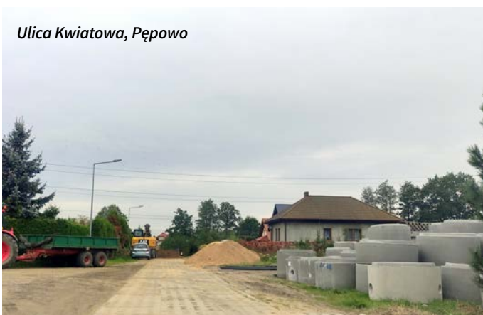
Ulica Kwiatowa, Pępowo