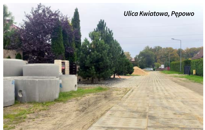
Ulica Kwiatowa, Pępowo