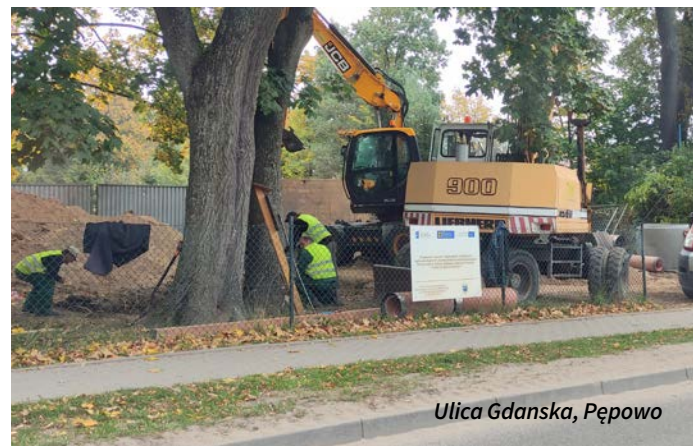
Ulica Gdanska, Pępowo