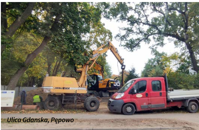
Ulica Gdanska, Pępowo