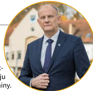
Wojciech Kankowski • Burmistrz Gminy Żukowo

Zachęcam także do zapoznania się z bieżącymi informacjami dotyczącymi inwestycji i wydarzeń z terenu gminy Żukowo i życząc owocnej lektury.